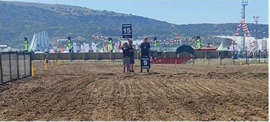
Tabela havaya kaldırılarak starta doğru gösterilir. 5 saniye tabelası gösterilir gösterilmez hemen parkurun kenarına çıkar. Direktör onayı ile start kapıları düşürülür ve start verilir.

Bütün yarışçılar start kapısına dizildikten sonra start hakemi tarafından yeşil bayrak yarışçılara hazır oldukları teyidini almak için gösterilir. Bunun ardından yarışçılara, direktör talimatıyla önce 15 saniye, sonra 5 saniye tabelaları gösterilir.